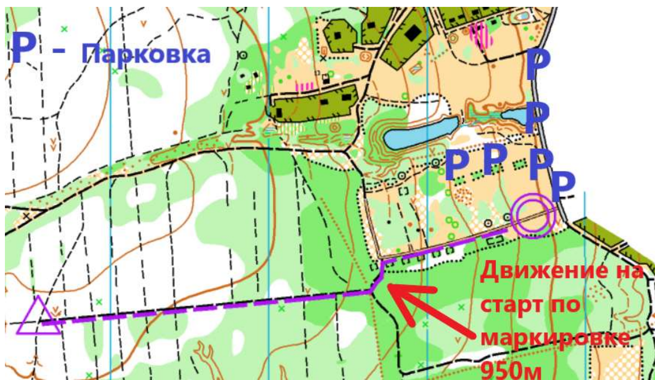
Схема арены соревнований:

Порядок прохождения финишной линии контролируется судьёй.