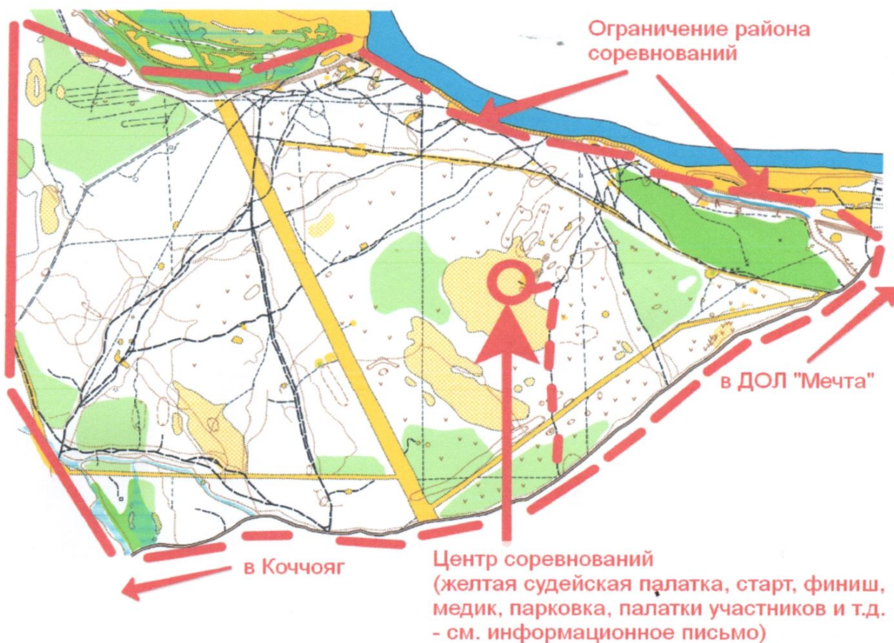
Схема района Соревнования:

Трассы Соревнований будут проходить вблизи ДООЦ «Мечта», «Орленок» и местечко Коччояг. Особенности местности и ограничения: на севере и востоке - река Вычегда, на западе – м. Коччояг, на юге асфальтированная дорога. Имеются буреломы, овраги и ручью. Сосновый бор.