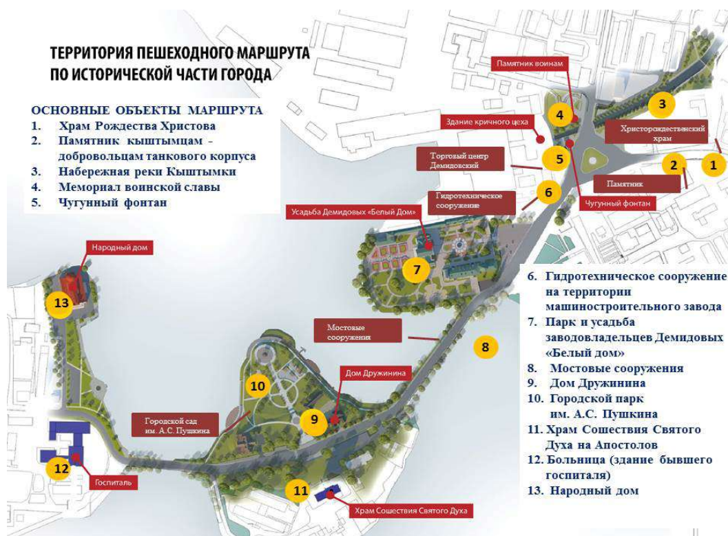
Схема пешеходной экскурсии: