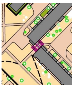
Символ 708 + 709