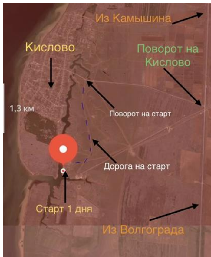
Схема проезда к старту 1 дня соревнований