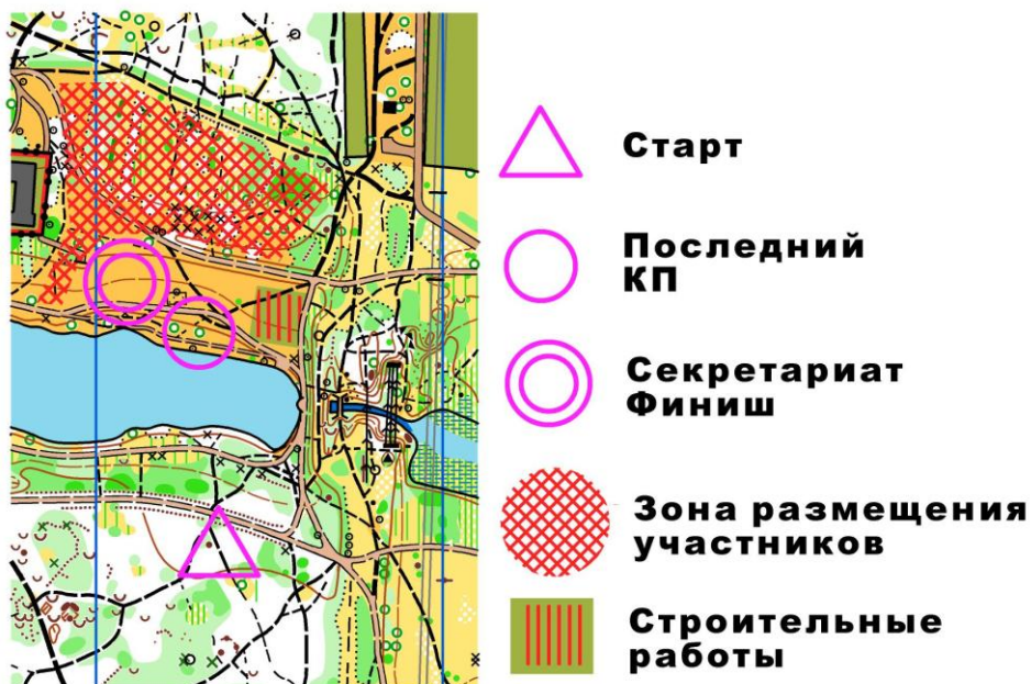
Схема центра соревнований:

Проезд: станции метро «Кузьминки», «Выхино», «Юго-Восточная», автобус 796 до остановки «Улица Чурилиха». Далее пешком по схеме около 400 метров.