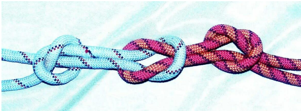
Прямой (морской) с контрольными узлами